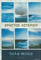
Το εξώφυλλο του βιβλίου

Ολα ξεκινούν με μια μικρογραφία του παγκόσμιου χωριού σε ένα έρημο εξωτικό νησί με το κωδικό όνομα Ιόλα Μπόα. Δέκα «παίκτες» από διαφορετικές χώρες με διαφορετική κουλτούρα και προσλαμβάνουσες, επιλέγονται από ένα παντοδύναμο αμερικανικό κανάλι για να συμμετάσχουν σε ένα πείραμα συμβίωσης και επιβίωσης που θα αποτελέσει τη ναυαρχίδα του χειμερινού τηλεοπτικού προγράμματος και θα αποφέρει στον νικητή ένα εκατομμύριο δολάρια. Όλοι τους αισθάνονται μαιτωμένοι, στριμωγμένοι, απελπισμένοι και αναζητούν μια διέξοδο σε μια καινούργια ζωή. Οι οργανωτές το ξέρουν αφού έχουν ερευνήσει τα προφίλ τους, και ποτάρουν σ' αυτό στέλνοντας ως εκπροσώπους τους στο νησί τον σκηνοθέτη και τον παρουσιαστή που επίσης διμυούν για νέα καριέρα.